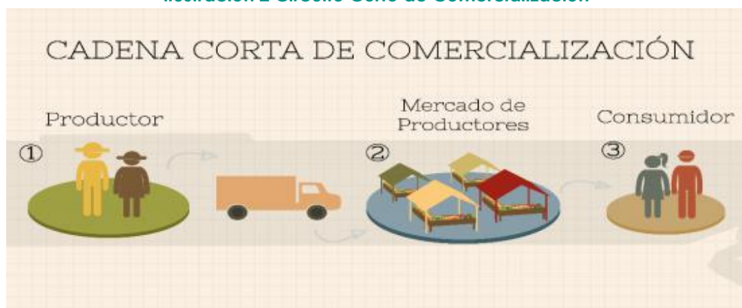
Ilustración 2 Circuito Corto de Comercialización 3

calidad de los productos y cercanía al hogar del sitio de compra. En los estratos 1,2 y 3, prima el factor del precio, mientras en los demás, la calidad, es fundamental al momento de hacer la compra.